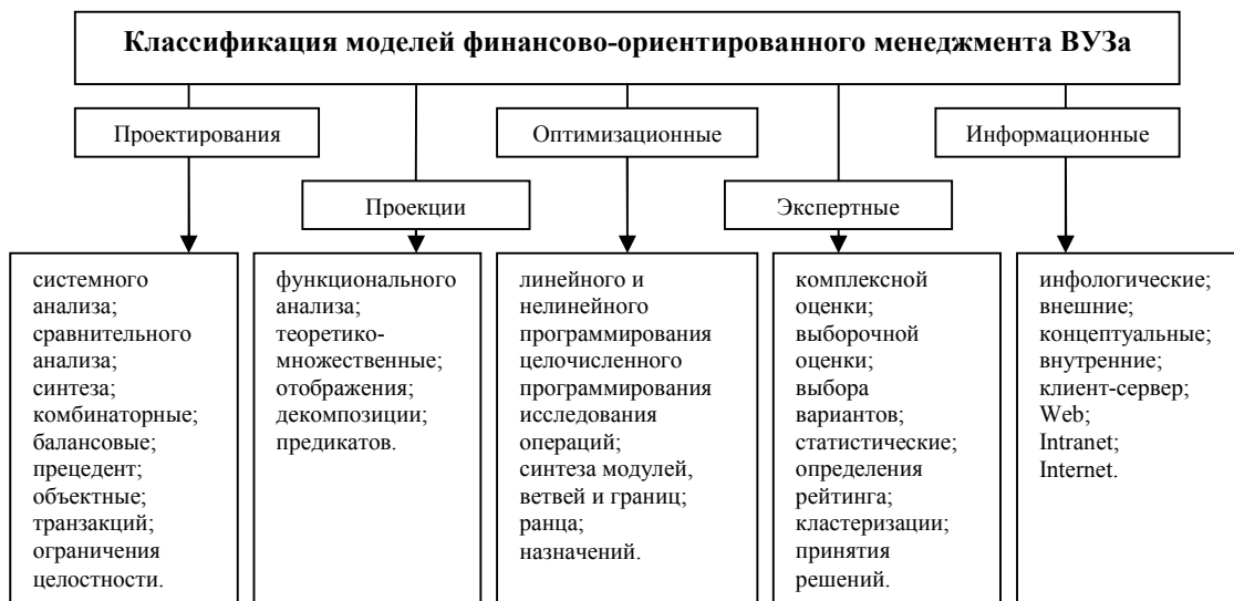
Рис. 2. Комплекс моделей финансово-ориентированного менеджмента ВУЗа

Реализацию финансово-ориентированного менеджмента обеспечивает комплекс моделей, классификация которых представлена на рис. 2.