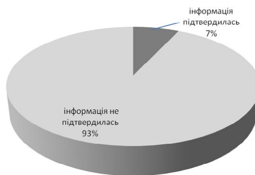
Рис. 4. Стан підтвердження інформації, наведеної у скаргах громадян, посадових осіб підприємств, установ, організацій на дії працівників КРУ в Харківській області у першому півріччі 2011 року

Приведені на рис. 4 дані вказують на те, що відсоток підтвердження фактів порушень дуже малий. Аналогічна ситуація за попередні роки. У 2008 році підтверджено 13% скарг, у 2009 році – 10%, у 2010 – 3%. Тобто не досить раціонально використовуються трудові ресурси. На думку авторів, більш раціонально було б відмовитись від даного виду прийому скарг, а приймати їх лише через «телефон довіри».