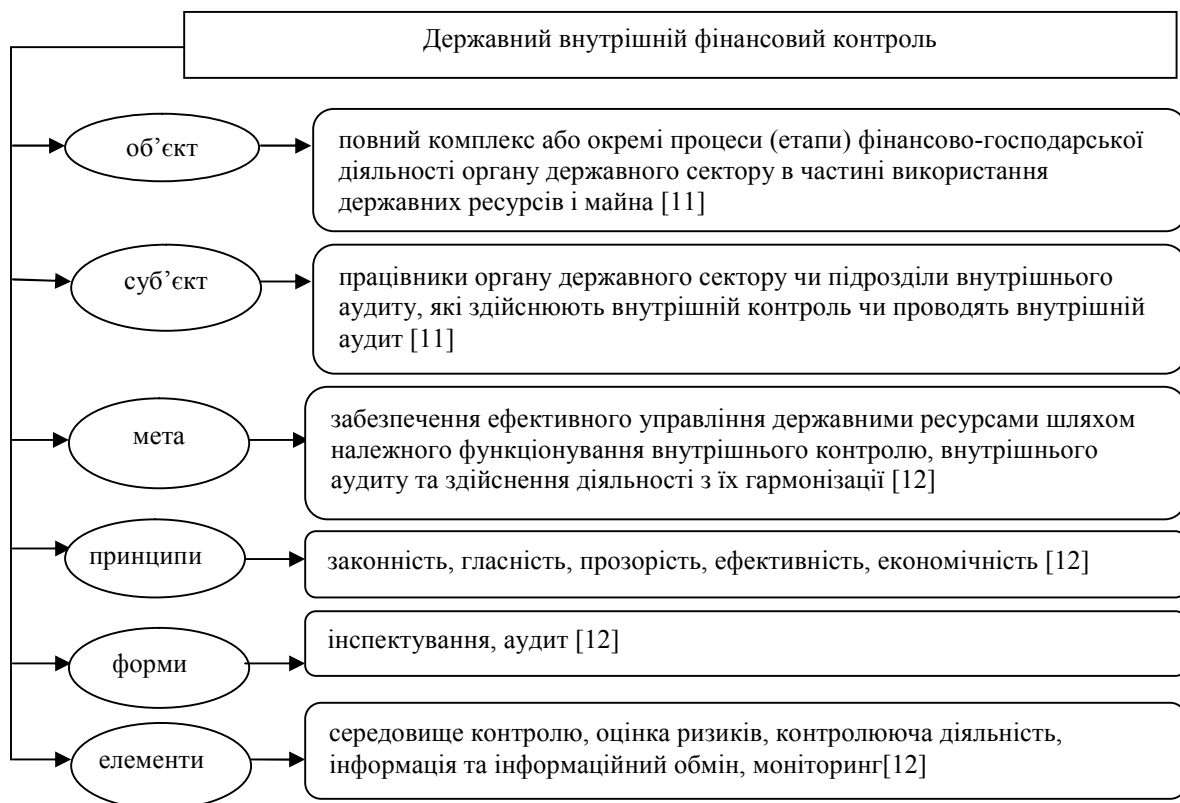
Рис. 1. Основні компоненти змісту ДВФК

На рис. 1 представлені основні компоненти, які визначають змістовне підґрунтя внутрішнього фінансового контролю на державному рівні.