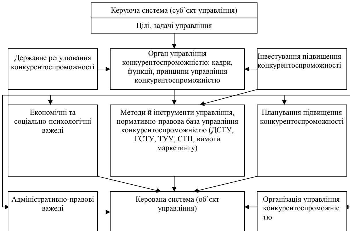
Рис. 1. Схема механізму управління конкурентоспроможністю харчового підприємства

Центральне місце в ньому займає орган управління, який необхідно створити на підприємстві або, в окремих випадках, ці функції можна покласти на відділ маркетингу. Цей орган управління повинен вести аналіз кон'юнктури ринку і розробляти програму підвищення конкурентоспроможності підприємства: підвищення якості харчової продукції, зниження собівартості і цін, впровадження маркетингових заходів щодо формування попиту, збуту; здійснювати контроль і аналіз конкурентоспроможності підприємства та забезпечувати її підвищення.