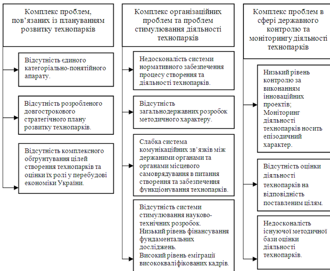
Рис. 3. Головні проблеми державного управління технопарками

Таким чином, можна дійти висновку, що створення ефективного механізму державної підтримки технопарків має забезпечити реалізацію наступних заходів: