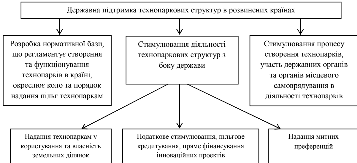
Рис. 1. Схема напрямків державної підтримки технопарків в розвинених країнах

в обсягах реалізованої інноваційної продукції склала близько 10%, то у 2009 р. відбулось зниження до 1,1% [1]. Докладніше взаємозв'язок між скороченням державної підтримки та відрахуванням коштів до бюджету з боку технопарків демонструє рисунок 2.