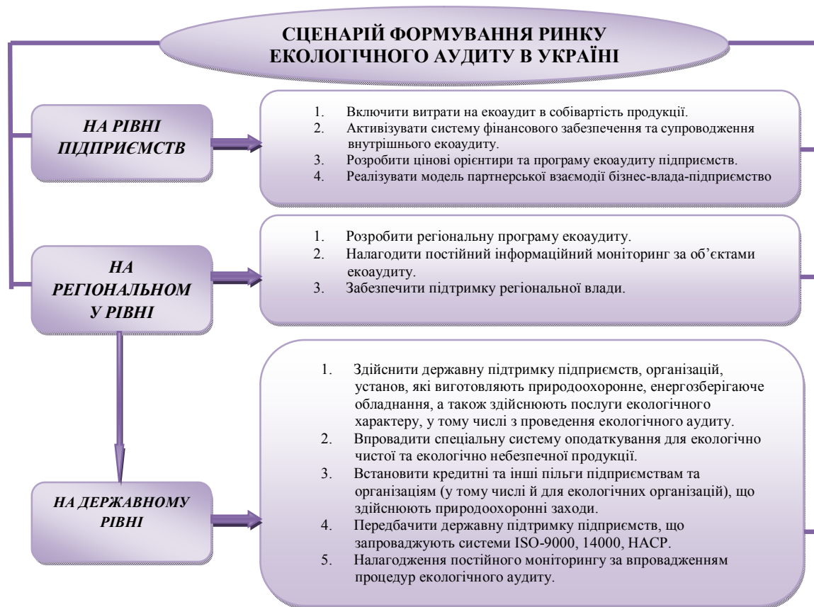
Рис. 2. Сценарій формування ринку екологічного аудиту в Україні

— друга група (економічна) – виконання фінансово-економічних зобов'язань та сплата обов'язкових платежів.