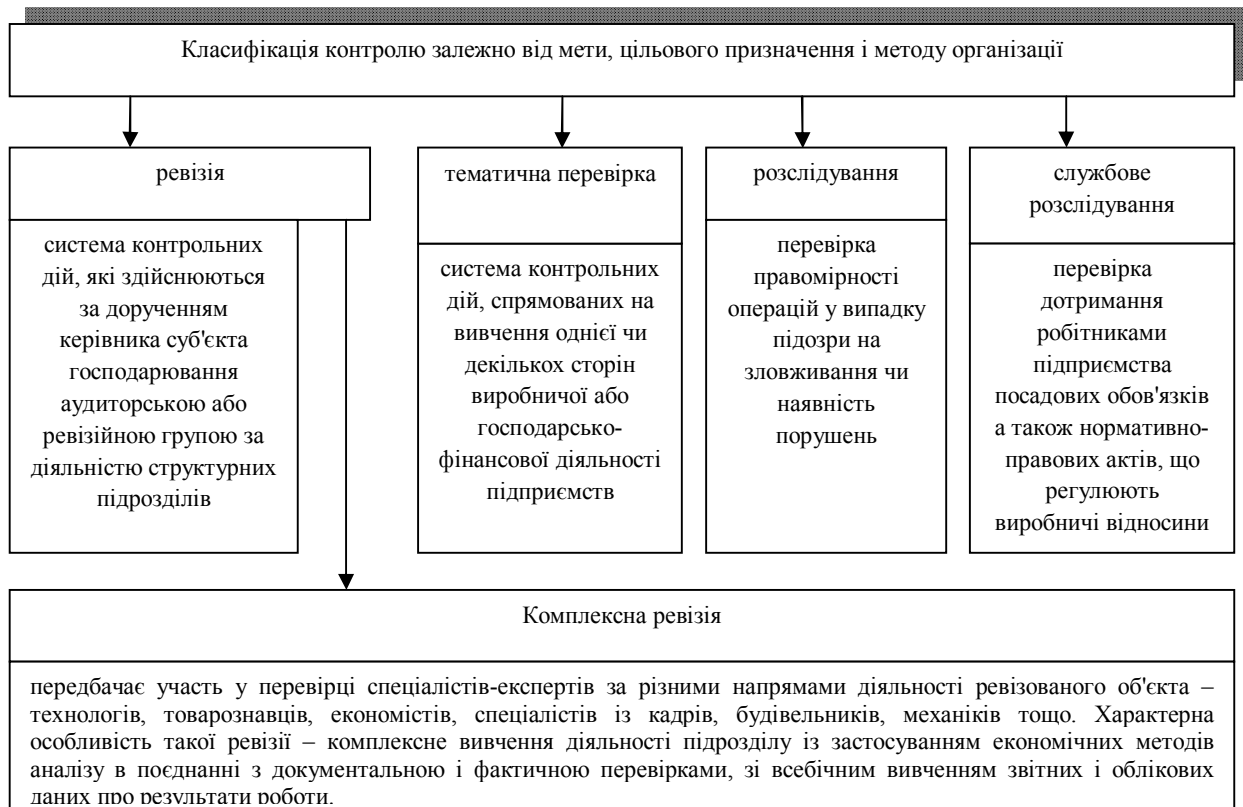
Рис. 2. Класифікація внутрішнього контролю залежно від мети, цільового призначення та методу організації

Залежно від мети, цільового призначення та методу організації розрізняють ревізію, аудит, тематичну перевірку, розслідування і службове розслідування (рис. 2).