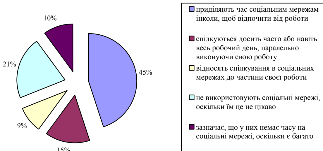
Рис. 1. Користування соціальними мережами в робочий час офісними працівниками [9]

портал» серед зареєстрованих користувачів. За результатами даного дослідження (рис. 1): 45% респондентів приділяють час соціальним мережам інколи, щоб відпочити від роботи; 15% – спілкуються досить часто або навіть весь робочий день, паралельно виконуючи свою роботу; 9% – відносять спілкування в соціальних мережах до частини своєї роботи; 21% – не використовують соціальні мережі, оскільки їм це не цікаво; 10% – зазначає, що у них немає часу на соціальні мережі, оскільки є багато роботи [9].