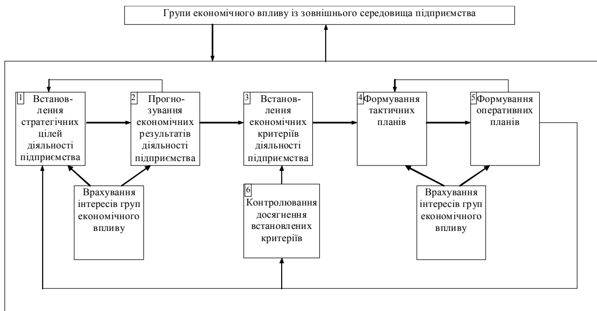
Рис. 2. Загальна схема функціонування системи планування діяльності машинобудівного підприємства при врахуванні вимог груп економічного впливу (розроблено автором на основі аналізування літературних джерел [1-9])

На основі розгляду [2, 5-7] підкреслимо, що на сьогодні існує широкий спектр якісних та кількісних критеріїв функціонування машинобудівного підприємства. Серед таких критеріїв найчастіше виділяють обсяг продажу, рівень задоволеності споживачів, вчасність поставки, прибуток, частка ринку, рівень обізнаності споживачів щодо торгової марки тощо. При встановленні таких