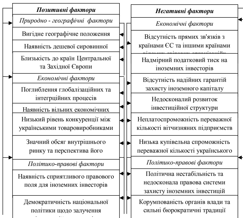
Рисунок 4. Фактори впливу на рух іноземних інвестиційних потоків в харчову промисловість України

ловість, як зону дії підвищеного ризику для функціонування масштабних інвестиційних потоків. Обережність та нерішучість потенційних інвесторів у прийнятті фінальних рішень в подібній обставині – закономірний факт. Для заохочення та зміцнення руху іноземних інвестиційних потоків в пріоритетні галузі економіки держави, зокрема в харчову промисловість, скерований Закон України «Про державну програму заохочення іноземних інвестицій в Україні», що передбачає надання різного роду страхових гарантій, особливо по найбільш важливим інвестиційним програмам і проектам, розвитку інфраструктури міжнародного бізнесу, покращення правового регулювання іноземного інвестування [9].