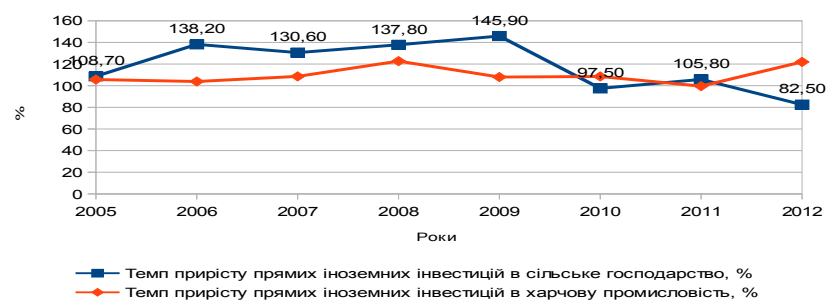
Рисунок 3. Темп приросту прямих іноземних інвестиційних потоків у сільське господарство та харчову промисловість, млн. дол. США

В цілому в 2012 році частка прямих іноземних інвестиційних потоків в харчовій промисловості України помітно зростає і становить 20% від суми активів харчової промисловості України.