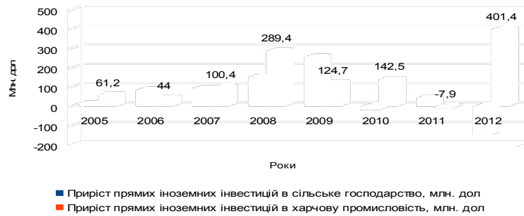
Рисунок 2. Приріст прямих іноземних інвестиційних потоків в сільське господарство та харчову промисловість, млн. дол. США