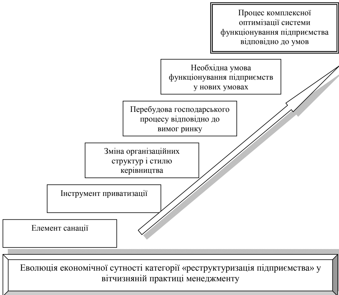
Рис. 1. Еволюція економічної сутності категорії «реструктуризація підприємства» у вітчизняній практиці менеджменту Джерело: побудовано на підставі [5, 6, 8]

У процесі становлення та розвитку ринкових механізмів і реалізації трансформаційних перетворень національної економічної системи відбувалася адекватна зміна економічної сутності поняття «реструктуризація підприємства» (рис. 1), що було обумовлено таким основними факторами, як: 1) особливості галузей, форм власності та структур господарюючих суб'єктів; 2) визначення та встановлення відповідності рівнів реалізації процесу реструктуризації (держава-регіон-підприємство); 3) вплив чинників внутрішнього і зовнішнього середовища тощо.