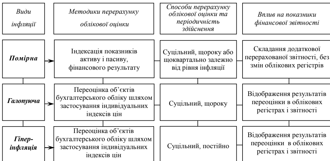
Рис. 2. Процедури коригування облікових даних на вплив інфляції

Аналіз існуючих видів інфляції на предмет їх впливу на систему бухгалтерського обліку показав, що найбільш значний вплив і суттєві зміни здійснює інфляція за рівнем зростання цін: помірною, галопуючою та гіперінфляцією. Здійснення коригувань даних бухгалтерського обліку залежить від величини відхилень оцінки активів і джерел їх утворення у різних періодах. Нормативними документами не передбачено диференційованого підходу, у зв'язку з чим доцільно розробляти на підприємстві внутрішні положення щодо порядку перерахунку показників бухгалтерського обліку та звітності відповідно до рівня зміни вартостей (рис. 2).