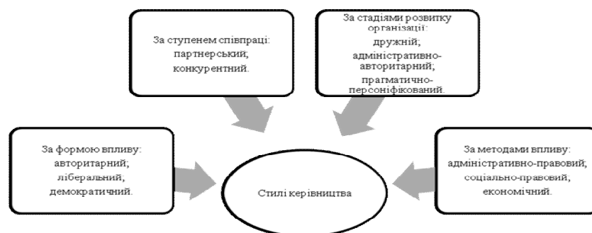
Рис. 3. Види стилів керівництва

Розглянемо детальніше кожний стиль керівництва (рис. 4) [11]: