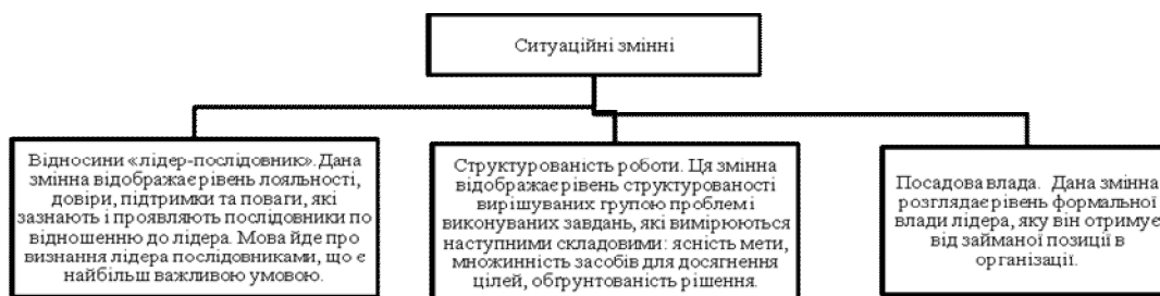
Рис. 2. Змінні, які визначають ступінь контролю ситуації в моделі

Сприятливість ситуації по відношенню до конкретного використаного стилю визначається через три раніше розглянуті ситуаційні змінні (рис. 2). Це означає, що ефективність лідерства залежить від того наскільки ситуація дає лідеру можливість впливати на інших людей.