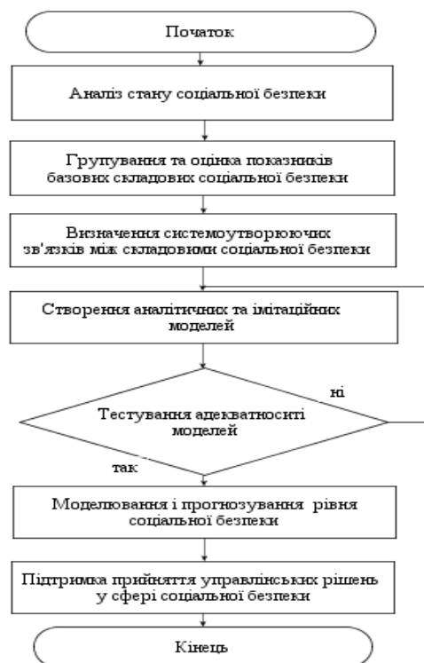
Рис. 3. Технологія прийняття управлінських рішень у сфері соціальної безпеки

Програмний інструментарій імітаційного моделювання дозволяє досліджувати слабкоструктурованість соціальної системи, управління якої пов'язано з прийняттям управлінських рішень в умовах невизначеності поведінки системи. Однією з вагомих переваг цього методу є збільшення числа можливих альтернатив розгляду ситуації на основі наборів алгоритмів, які відображують реальну ситуацію, з'являються варіанти для покращення якості та дієвості управлінських рішень. Використання такого методичного підходу дозволяє з системних позицій конструювати моделі реальної соціальної системи, здійснювати аналіз динамічних процесів, проводити експерименти над моделлю з метою оцінки стратегії розвитку, апробувати теорії та гіпотези, які пояснюють поведінку системи та будувати прогнози майбутнього стану. В сучасних умовах зростання нелінійності та нерівноважності соціального та економічного розвитку, для дослідження системи забезпечення соціальної безпеки характерна концепція імітаційного моделювання – системна динаміка.