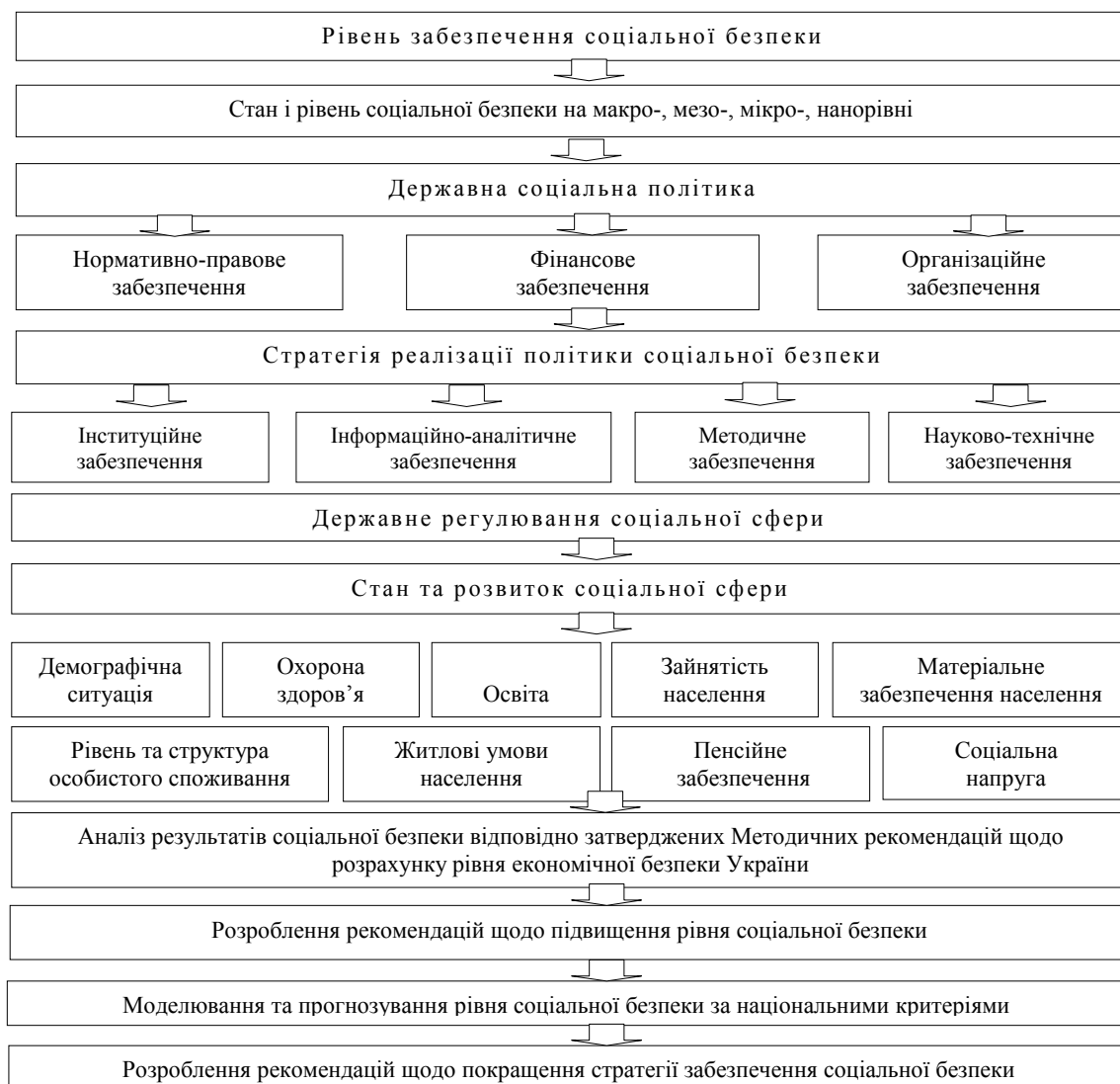
Рис. 1. Структура управління соціальною безпекою

Управління соціальною безпекою охоплює комплекс організаційно-управлінських заходів на макро-, мезо-, мікро-, нанорівні, що реалізуються через механізм державної політики щодо здійснення основних стратегічних цілей у напрямі забезпечення стабільного розвитку соціальної сфери та запровадження механізмів саморегуляції досягнення оптимального рівня безпеки (рис 1).