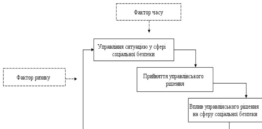
Рис. 2. Схема процесу прийняття управлінського рішення

Виокремимо складові управління соціальними процесами: формування цілей та пріоритетів розвитку, орієнтованих на отримання конкретних результатів; створення концепції розвитку соціальної сфери; розроблення механізму функціонування соціальних галузей, який забезпечить вимірювальне досягнення визначених цілей; розроблення системи критеріїв та індикаторів досягнення визначених цілей [2]. У системі управління соціальною безпекою рішення є елементом зворотного зв'язку, цільове спрямування якого повинне забезпечувати реалізацію процесу управління. Слід зазначити, що фактор часу та фактор ризику є одним із визначальних домінант в процесі ухвалення управлінського рішення (рис. 2) Дослідження ризиків у розвитку соціальної сфери дозволяє визначити здатність цієї сфери формувати інформаційне суспільство, знання економіку, здатність до ведення господарської діяльності в умовах невизначеності та необхідності вибору, зменшення негативного впливу на результати господарської діяльності [7].