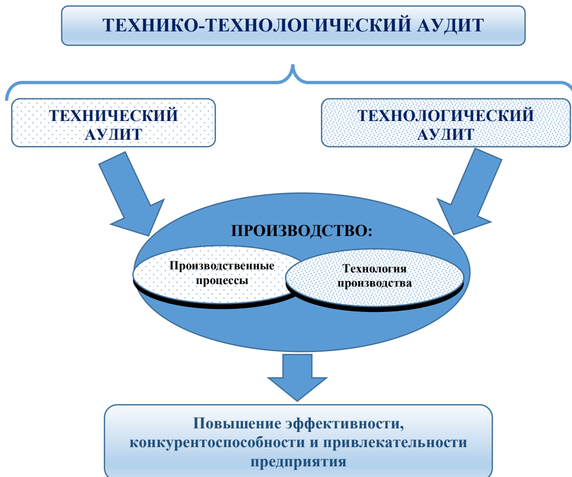
Рис. 1. Взаимосвязь технического, технологического и технико-технологического аудита

Техничко-технологический аудит, как правило, проводится на крупных предприятиях. Поэтому аудиторский процесс является достаточно сложным и многоуровневым.