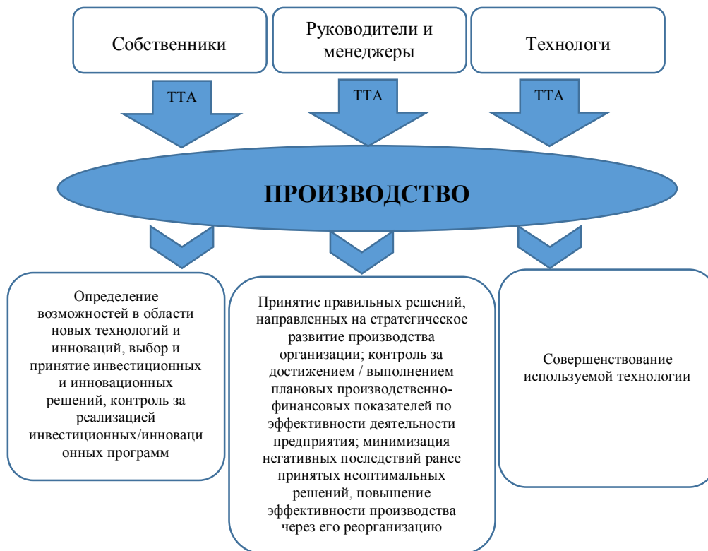
Рис. 2. Задачи, решаемые технико-технологическим аудитом (ТТА) для разных групп пользователей

тегическое развитие производства организации; контроль за достижением плановых производственно-финансовых показателей по эффективности деятельности предприятия; минимизация негативных последствий ранее принятых неоптимальных решений. Задача, которую решает технико-технологический аудит для менеджеров на производстве – контроль за выполнением плановых показателей, повышение эффективности производства через его реорганизацию. Одна из задач технолога предприятия – это сопровождение используемой технологии, ее совершенствование. Это также является функцией технико-технологического аудита. Схематично это представлено на рис. 2.