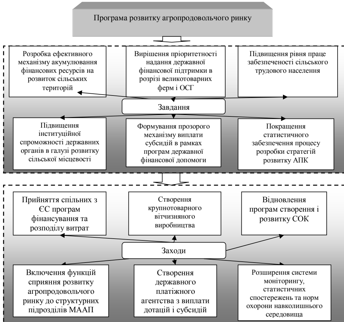
Рис. 2. Програма стратегічного розвитку агропродовольчого ринку

В сучасних умовах активізації інноваційної діяльності суб'єктів ринку сільськогосподарської сировини та готових продуктів харчування стратегія державного стимулювання інноваційних структур може бути реалізована у вигляді таких конкретних важелів і форм: інвестиційний податковий кредит, дослідницький податковий кредит, інвестиційна податкова знижка (рис. 3).