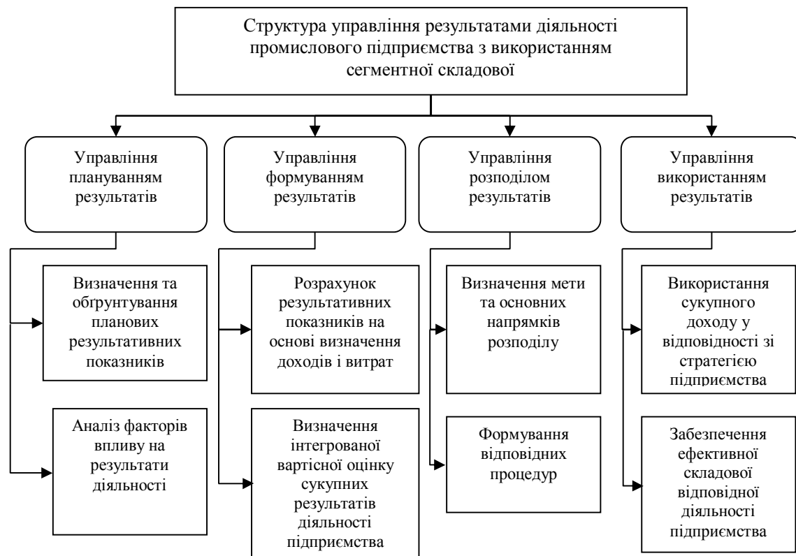
Рис. 1. Структура управління результатами діяльності промислового підприємства

Важливим елементом процесу управління формуванням результатів діяльності є розрахунок результативних показників на основі визначення доходів і витрат.