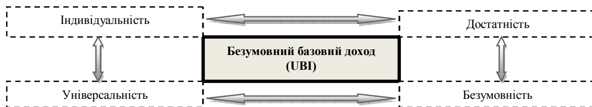
Рис. 1. Ознаки безумовного базового доходу (UBI)

— універсальність, яка означає, що кожна особа, безвідносно віку, місця проживання, професії, потреб може претендувати на його отримання;