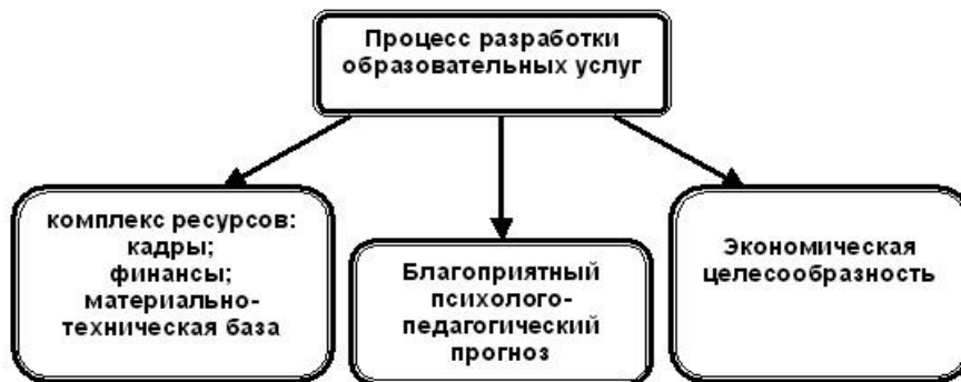
Рисунок 2 – Основные требования к внедрению новой образовательной услуги.

Решение о внедрении новой образовательной услуги принимается на основе комплекса требований, среди которых соответствие образовательной услуги как стратегическим, так и тактическим целям развития вуза, обладание необходимым научным, методическим, кадровым, материально-техническим и финансовым потенциалом для освоения данной образовательной услуги, а также позитивные экономические прогнозы от реализации данной услуги (см. рис. 2).