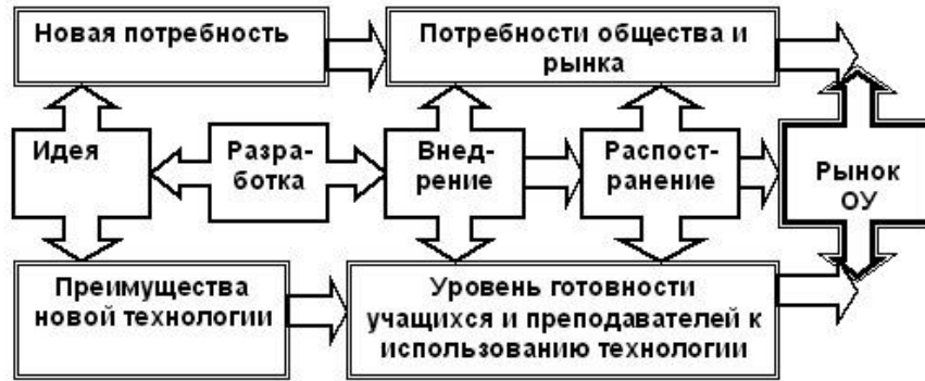
Рисунок 1 – Интерактивная модель инновационного процесса.

Решение о внедрении новой образовательной услуги принимается на основе комплекса требований, среди которых соответствие образовательной услуги как стратегическим, так и тактическим целям развития вуза, обладание необходимым научным, методическим, кадровым, материально-техническим и финансовым потенциалом для освоения данной образовательной услуги, а также позитивные экономические прогнозы от реализации данной услуги (см. рис. 2).