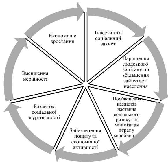
Рис.3 Цикл взаємозв'язку соціального забезпечення і економічного росту

Наявність соціальних ризиків сприяє розвитку соціального захисту і соціального забезпечення. Соціальний захист може потенційно зменшити незахищеність працівників та допомогти формалізувати трудові договори, тим самим сприяючи гідній роботі. Соціальний захист – це інвестиція в людський капітал, необхідна умова економічного зростання, оскільки успішні економіки залежать від якості їхньої робочої сили і здоров'я нації. Соціальний захист сприяє покращенню здоров'я працівників, що призводить до підвищення продуктивності праці, розширення можливостей доходу та введення грошових коштів у громади та економіку. Такі схеми, як допомога по інвалідності, також допомагають інвалідам отримати доступ до робочої сили, забезпечуючи додаткові доходи. Тому важливим для уряду України є вкладення коштів у потенціал та навички дітей та молоді для підготовки до вступу на ринок праці. Соціальне забезпечення створює цикл, що сприяє економічному зростанню шляхом підтримки і мотивування потужної та продуктивної робочої сили та стимулювання економічної активності. Крім того, соціальне забезпечення має на меті захист громадян в період життєвих труднощів та криз, сприяти необхідним структурним перебудовам економіки та стимулювати місцевий та національний ринки шляхом введення грошових коштів (рис. 3). Крім того, соціальний захист та соціальне забезпечення також зміцнює соціальну згуртованість і створює важливий інструмент для подолання нерівності.