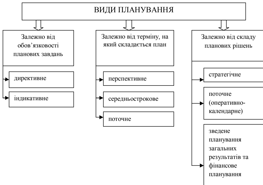
Рис. 4. Класифікація видів планування

3) зведене планування загальних результатів та фінансове планування – планування, що містить у своїй основі роботу зі зведеними показниками діяльності, які стосуються фінансової сфери як на рівні держави, так і організації.