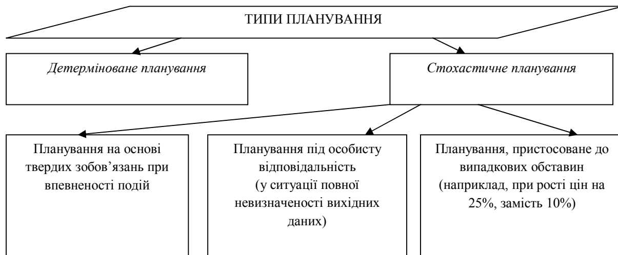
Рис. 3. Класифікація типів планування

Другий тип – стохастичне планування, яке припускає певну невизначеність у зовнішньому ринковому середовищі і часткову відсутність правдивої інформації, яка стосується вихідних даних для планування. Даний тип не дає повної передбачуваності результатів. Дана невизначеність може бути спричинена ступенем економічного розвитку, історичним періодом та інше.