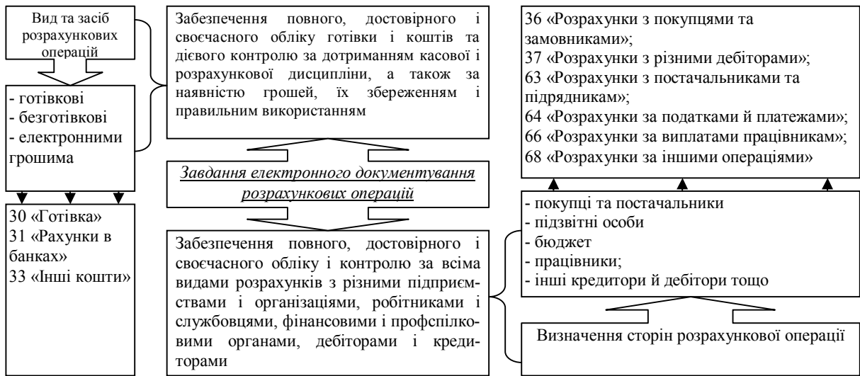
Рис. 3. Організація системної обробки інформації з обліку розрахункових операцій