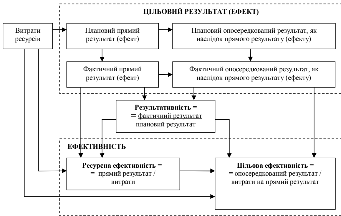
Рис. 1. Диференціація понять «ефект», «ефективність», «результативність», «ресурсна ефективність», «цільова ефективність»

Успішна реалізація стратегії розвитку підприємства передбачає здійснення не лише результативної, а й ефективної господарської діяльності. Щоб бути успішною впродовж тривалого часу, щоб вижити і досягти поставлених цілей, діяльність підприємства має бути як результативною, так і ефективною [6]. При цьому результативність, на нашу думку, можна вимірювати не тільки співвідношенням результату до плану, але і динамікою зміни цільового результату в більший чи в менший бік, в залежності від критеріїв оцінки.