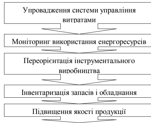
Рис. 1. Шляхи підвищення прибутковості підприємства