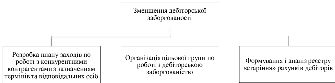
Рис. 2. Заходи щодо скорочення дебіторської заборгованості

На кожному підприємстві економія енергоносіїв повинна стати не одноразовим заходом, а регулярною системною роботою в кожному підрозділі. Переорієнтація інструментального виробництва з переважного задоволення внутрішніх потреб на випуск також і товарної продукції є пріоритетним направленням у діяльності підприємства.