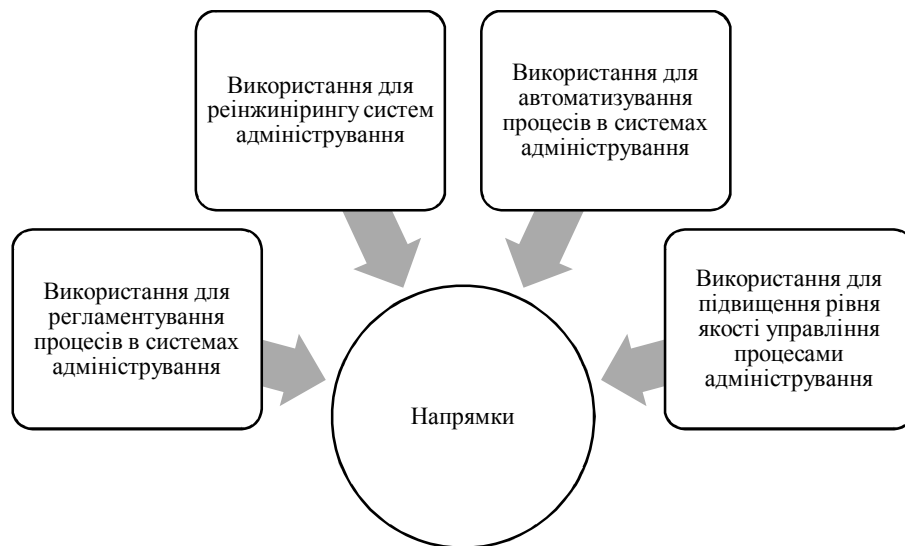
Рис. 1. Ключові напрямки використання результатів оцінювання рівня сформованості систем адміністрування в управлінні підприємствами

Оцінювання рівня сформованості систем адміністрування в управлінні підприємствами у стратегічній чи тактичній перспективах забезпечує можливість автоматизування відповідних процесів (наприклад, інформаційно-документаційних потоків, алгоритмів дій тощо) (рис. 1). При цьому, важливо розуміти усі процеси в таких системах, на високому рівня управляти ними, їх регламентувати, контролювати тощо. Як, зокрема, зауважують В.В. Кондратьєв та М.Н. Кузнєцов [1], «побудова діаграм потоків даних відіграє роль вихідного технічного завдання для налаштування інформаційних систем управління, які і повинні підтримувати такі потоки даних з використанням програмних засобів».