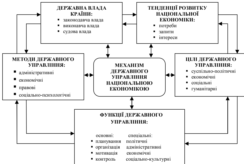
Рис. 1. Взаємодія складових механізму державного управління економікою національного господарства України

структур) і правові (визначають зміст державного регулювання та відповідальність суб'єктів за їх невиконання).