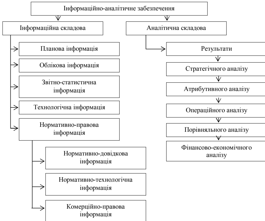
Рисунок 2. Система інформаційно-аналітичного забезпечення підприємства

аналіз, стратегічний аналіз, стратегічне ціноутворення, аналіз життєвого циклу, аналіз ланцюжка цінностей, побудова карт бізнес-процесів, ABC-аналіз, XYZ-аналіз, SWOT-аналіз та функціонально-вартісний аналіз (ФВА).