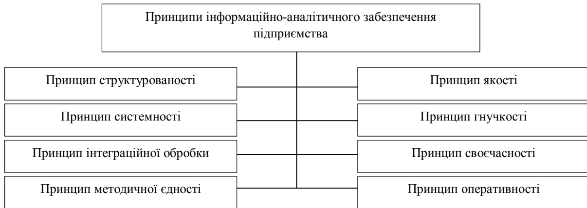
Рисунок 1. Принципи інформаційно-аналітичного забезпечення

Зауважимо, що кожен з перерахованих принципів враховує специфіку функціонування інформаційно-аналітичного забезпечення для створення сприятливих умов ефективного управління результатами діяльності промислового підприємства.