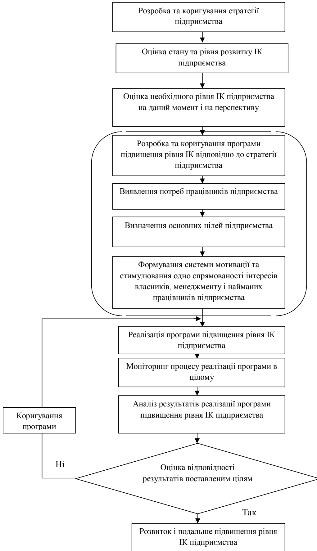
Рис.1. Алгоритм формування стратегії управління інтелектуальним капіталом підприємства