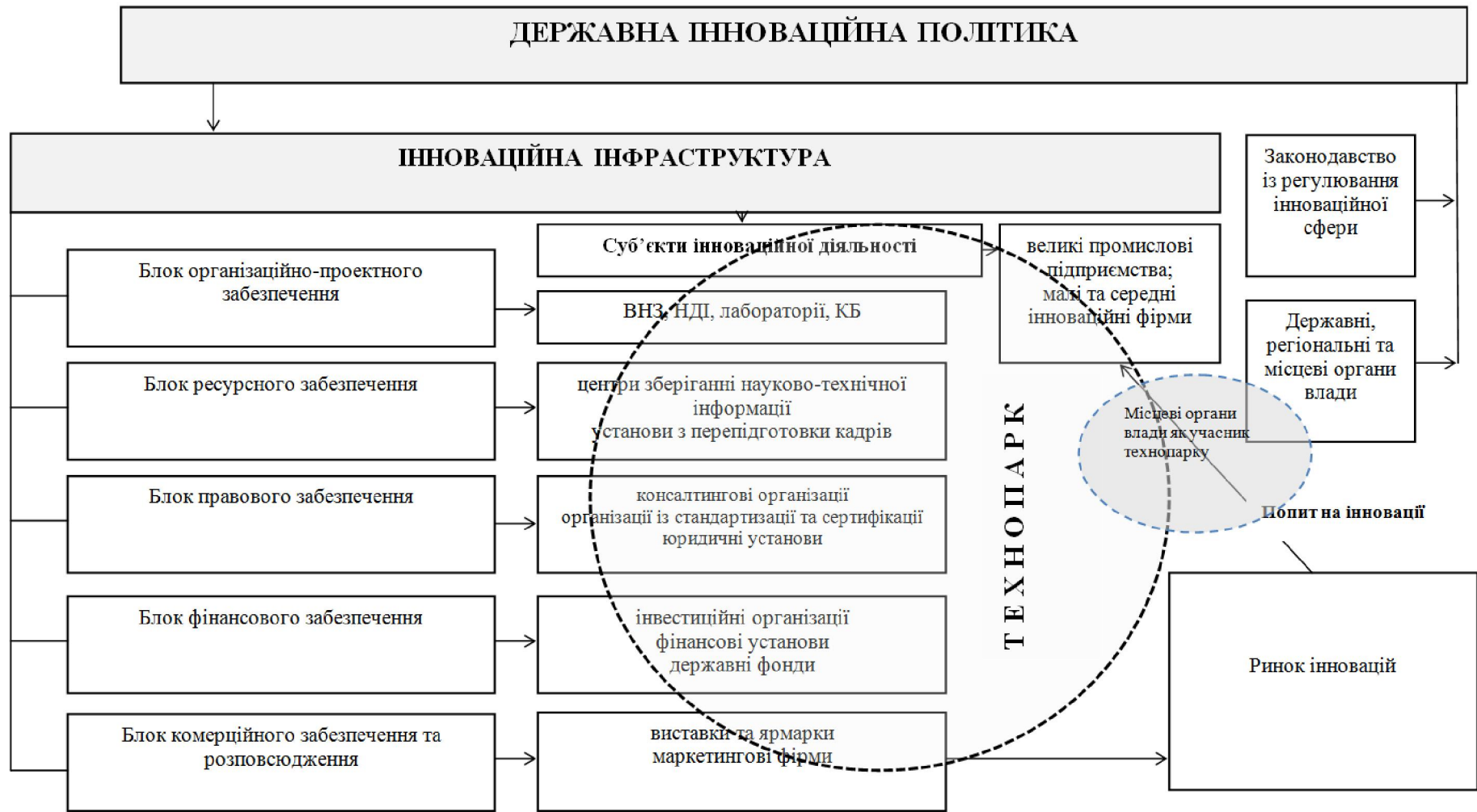
Рисунок 1 – Місце та функції технопарків у інноваційній інфраструктурі при реалізації державної інноваційної політики