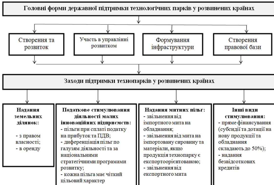
Рисунок 2 – Форми та заходи державної підтримки технологічних парків у розвинених країнах

Формування механізму державної підтримки технологічних парків, як показує досвід розвинених країн, насамперед пов'язане з реалізацією основних функцій державного управління в розрізі планування діяльності, а також стимулювання та контролю виконання інноваційних проектів. Узагальнено головні форми підтримки технопарків у розвинених країнах відображає наступна схема (рис. 2.).